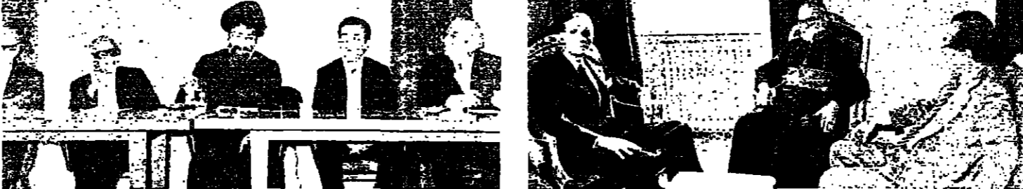
■ البطريرك خريش بتوسط العميد اده والشيخ يار الجليل في بركسي أمس

كان لسماحة مفتي الجمهورية الشيخ حسن خالد، وغبطة البطريرك الماروني انطونيوس خريش نصيب كبير من الاتصالات التي جرت أمس، وللوصول الى وقف إطلاق النار. فقد اجتمع البطريرك خريش مع للشيخ يار الجليل والعميد اده وعام الامام الصدر بصحبة اتصال مع رئيس الجمهورية والسيد محمود رياض، والرئيس الصلح، والسيد كمال جنابا لهمة الوضع. (التفاصيل على الصفحة ٢) كلمة الامام الصدر وبعد اذاعة اتفاق وقف إطلاق النار، وجه سماحة الامام الصدر كلمة الى اللبنانيين هذا نصها: « لقد اثبتت الاحداث الدائمة انكم عند ذلك ظن وطعمكم العظيم، وانكم كوطنكم اكبر من الجراح، وانكم في تحمل الالامة اصلب من الجبال. ان النار قد توقفت، والجسور السقفية، وانسحب المسلمون الى خارج طرابلس، قتل الهمة الصدة بنصف ساعة». وكان مسلحون قد تمركزوا في بناية الخزان بقلية وراحو يظفون النار على مسلحين يقيمون حواجز في الشوارع. وبعد قصف البناية بقذائف «اربيجي»، انسحب المبركزون فيها، الى هضبة جليليا وتمركزوا في محطة قطار الصليبين، والطقورا النار على زريعة الموائس في ابي سمرا، مما أدى الى مقتل محمد خالد سمرا، من الضحية (١٢ سة). كما قتل زوجة الممان في الجيش دعلى شحود، اثناء قصف بنينة خزان. ونوتر الموقف في طرابلس على الاثر البقية على ص ١٢ عمود ١.